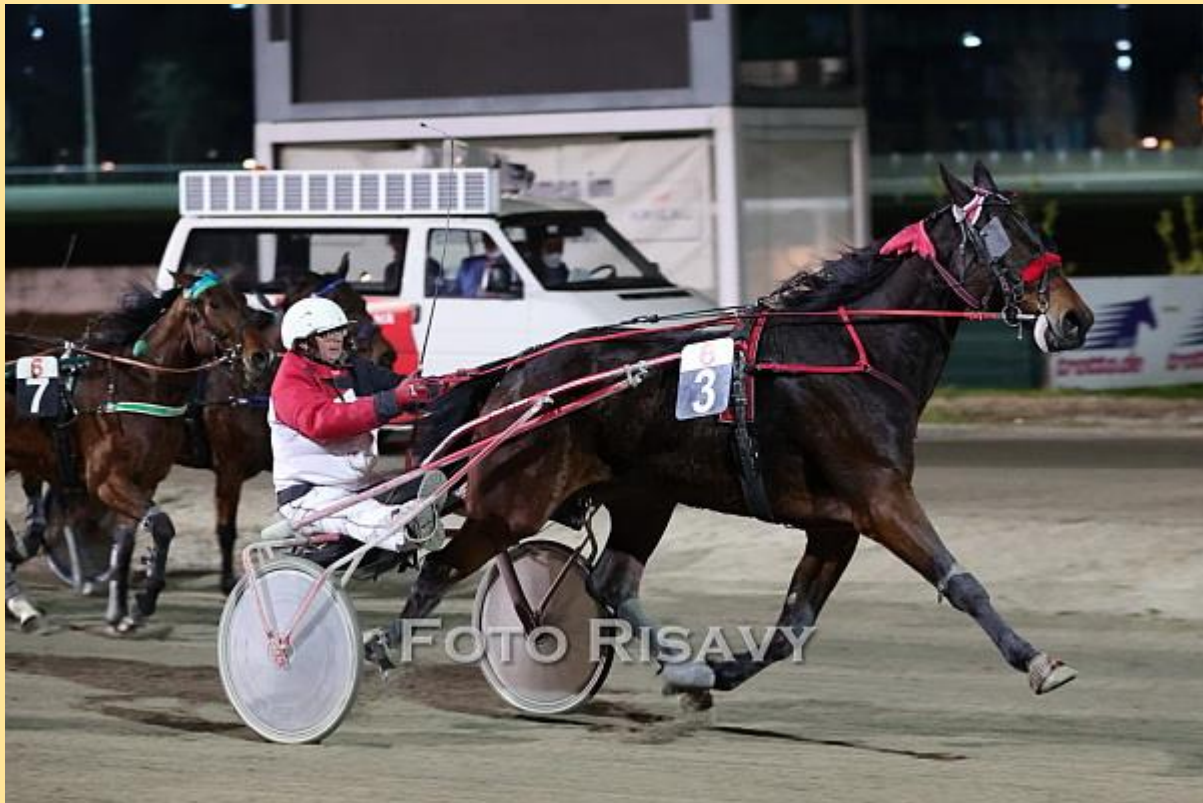
Zeigt Pinocchi O wie am 13.12. des Vorjahres der Konkurrenz die lange Nase?

Mit dem zweiten Amateurrennen des Tages geht es ins Finish, nämlich mit der Super Finishwette (V4) mit Auszahlungsgarantie. Über die Sprintstrecke sind etliche Rennverlauf-Szenarien denkbar und somit auch viele Sieger möglich. Xena Venus wird sich wohl mit Tosca Queen um die Spitze streiten, je nachdem wie aufwendig es Xena Venus hat stehen dann auch ihre Siegchancen, die von Haus aus mit möglicher Führung doch recht gut sein sollten. Aber auch Dallas Venus kann recht gut beginnen und ist sowohl mit der Führung als auch aus der Defensive ein heißer Sieganwärter. Vom Aufbau her und nach altem Sprichwort „beim dritten Start gilt's“ sollte auch Lanzelot L bei sehr guter Chance sein. Ein zu schnelles Rennen könnte für Contessa Venus oder Pinocchi O sprechen, Zweiterer ist ja für Überraschungen stets gut, siegte er doch bereits am 13.12. im Speed. Nicht vergessen sollte man auf den zuletzt in wieder besserer Form agierenden Revento J, der hinter zwei recht guten Beginnern aus der zweiten Reihe bald eine günstige Position für den Endkampf vorfinden könnte.